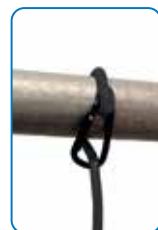
Bride avec puissant aimant et crochet intégrés