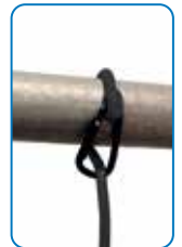
Indbygget strop med kraftig magnet og krog til ophænging.